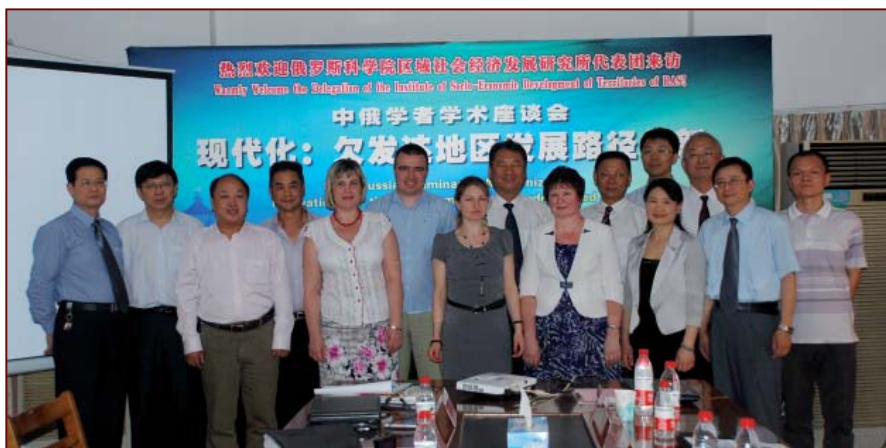
Участники научно-практического семинара «Инновации в развитии слабозажитых регионов»

Заинтересованность в развитии научных связей с Институтом социально-экономического развития территорий РАН выразили представители ряда научных институтов, входящих в структуру КАОН.