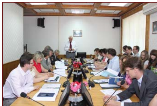
Заседание Учёного совета