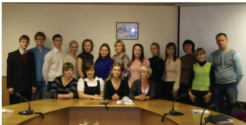
Преподаватели Научно-образовательного центра ИСЭРТ РАН

Приятно отметить, что в этом учебном году педагогический коллектив пополнили новые сотрудники – преподаватели социологии, экологии, здорового образа жизни, русской художественной литературы.