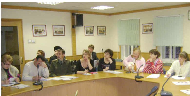
Родители учащихся 7-х классов НОЦ

Сотрудники НОЦ знакомили родителей с деятельностью Центра, с особенностями обучения на экономическом факультативе, рассказывали о традиционных мероприятиях.