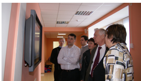
На экскурсии по школе

Открытие форума состоялось в здании Правительства Вологодской области.