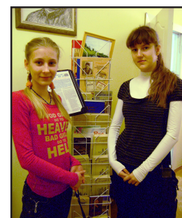
В музее ВоГТУ