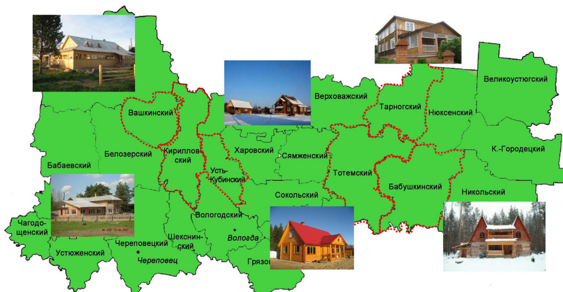
Рисунок 2. Развитие агротуризма в Вологодской области

нарию – 25% от общего числа фермерских хозяйств, второму – 5% хозяйств, третьему сценарию – 1% хозяйств (табл. 6).