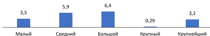
Рис. 1. Количество авторов, работающих в рамках класса МПК F04D, в расчете на 10 тыс. чел. населения в зависимости от масштаба города

Из общего количества исследователей на долю самостоятельных приходится от 2,4% в крупнейшем городе до 6,7% в малом городе, в среднем и крупном городе таковые отсутствуют (табл. 3). Среди единолично оформленных патентов в большом и крупнейшем городах свыше половины не были связаны с организациями. В свою очередь группы исследователей преимущественно работают в рамках служебных задач.