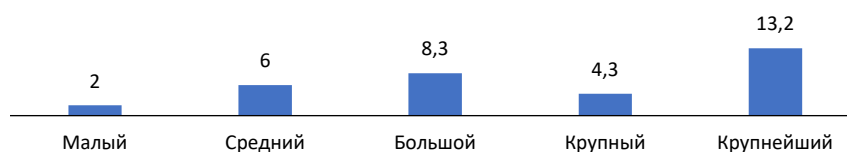
Рис. 2. Количество патентов в рамках класса МПК F04D в расчете на одну организацию в зависимости от масштаба города

Рассчитано по: База данных патентных документов РФ Федерального института промышленной собственности. URL: https://new.fips.ru/iiss/search.xhtml (дата обращения 26.07.2024).