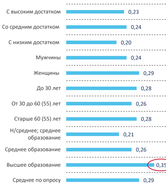
Рис. 2. Итоговый индекс участия (социально-демографический портрет)