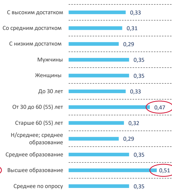
Рис. 3. Итоговый индекс установок (социально-демографический портрет)

Источник: Социологический опрос ВолНЦ РАН, май – июнь 2019 года.