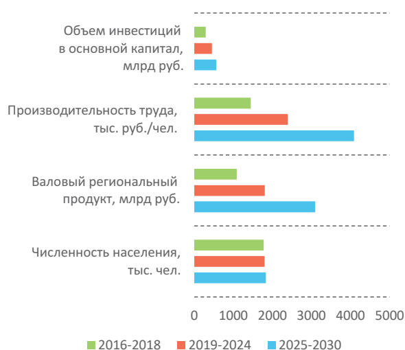
Рис. 5. Целевые показатели реализации Стратегии социально-экономического развития Ленинградской области до 2030 года

Ряд целевых показателей социально-экономического развития Ленинградской области представлен на рис. 5. Как видно из диаграммы, численность населения, по прогнозам специалистов, существенно не изменится. Объем инвестиций в основной капитал увеличится незначительно. Основные достижения прогнозируются в области повышения производительности труда и роста валового регионального продукта.