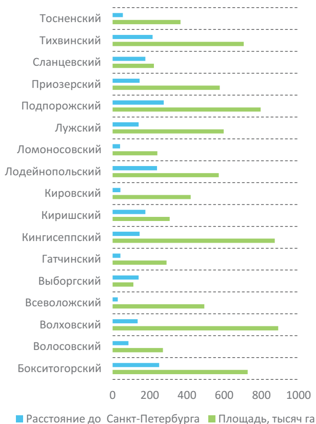
Рис. 2. Муниципальные районы Ленинградской области