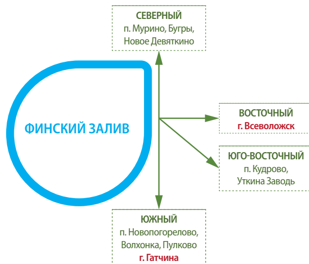
Рис. 3. Центры развития ТКР

Эта ситуация характерна не только для Санкт-Петербурга и области: по мнению Р.Р. Мавлютова, действующая в стране в настоящее время система территориального планирования не отвечает реально сложившимся условиям управления развитием ее территории [5].