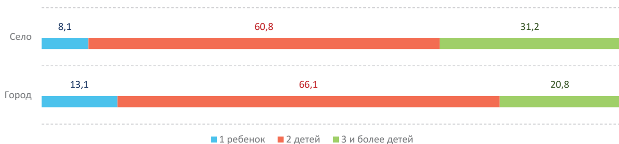
Рис. 2. Представления респондентов об идеальном количестве детей в семье, % от числа опрошенных

Низкую рождаемость исследователи связывают с усилением «качественной» составляющей родительства. Признание родителями необходимости культурных инвестиций в детей – дополнительного образования, воспитания, развития личности – требует от родителей как временных, так и материальных ресурсов. Возникновение и распространение представления об ответственном родительстве свидетельствует о появлении значительной категории родителей, рассматривающих процесс воспитания как важный жизненный «проект». В процессе воспитания