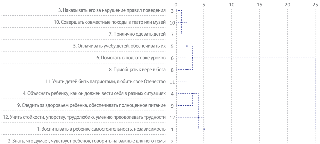
Рис. 4. Кластерная структура мнений населения о приоритетных задачах воспитания

щих ответы (рис. 4). Достаточно ярко выражена стратегия, приоритетом которой является развитие личности ребенка. Респонденты считают важным следить за здоровьем ребенка, объяснять, как нужно себя вести, учить стойкости, упорству, трудолюбию, воспитывать самостоятельность и независимость. В данном кластере отдельно выделяется направленность на охранительное поведение: следить за здоровьем и питанием и объяснять, как нужно себя вести. Во втором кластере акцентируется «формальная» сторона воспитания, связанная с представлениями о том, что должен делать «хороший родитель». При этом коррекция поведения ребенка осуществляется не в процессе объяснения, а через наказание. В данном кластере прослеживается связь между патриотическим и религиозным воспитанием и посещением театров/музеев, что можно трактовать как духовную направленность воспитания. При этом частью респондентов совместные походы в театр или в музей рассматриваются, скорее, как определенная статья расходов на ребенка, чем как приобщение к культуре и духовное развитие, так как они теснее связаны с задачей «прилично одевать ребенка».