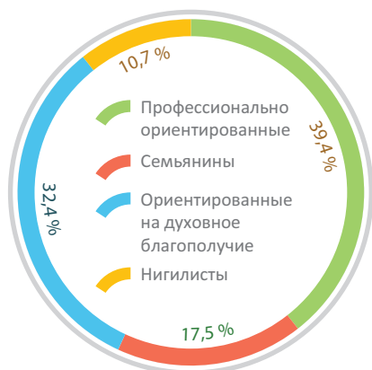
Рис. 1. Стратегии респондентов, %

кластерному (метод k-means) анализу, в результате были выделены 4 группы респондентов (рис. 1).