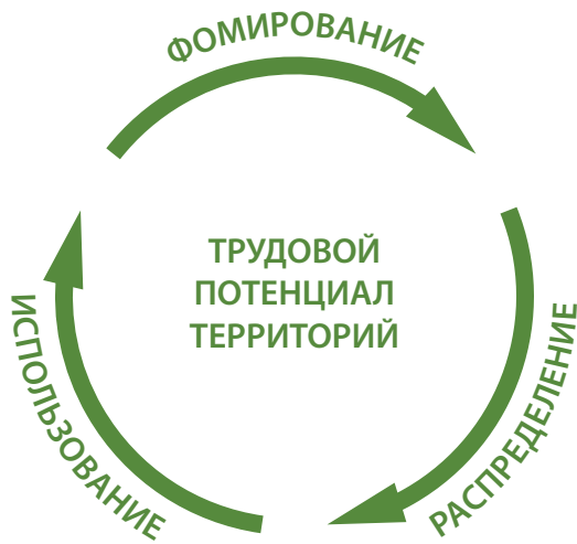
Рис. 3. Фазы воспроизводственного цикла

Воспроизводство трудового потенциала как процесс его непрерывного выполнения и возобновления принято конструктивно разделять на последовательные фазы воспроизводственного цикла (рис. 3): формирование (производство), распределение (обмен, перераспределение) и использование (функционирование, потребление, реализация).