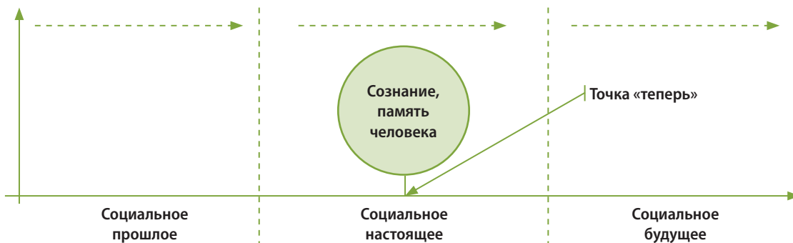
Рис. Концептуальная модель социальной перспективы