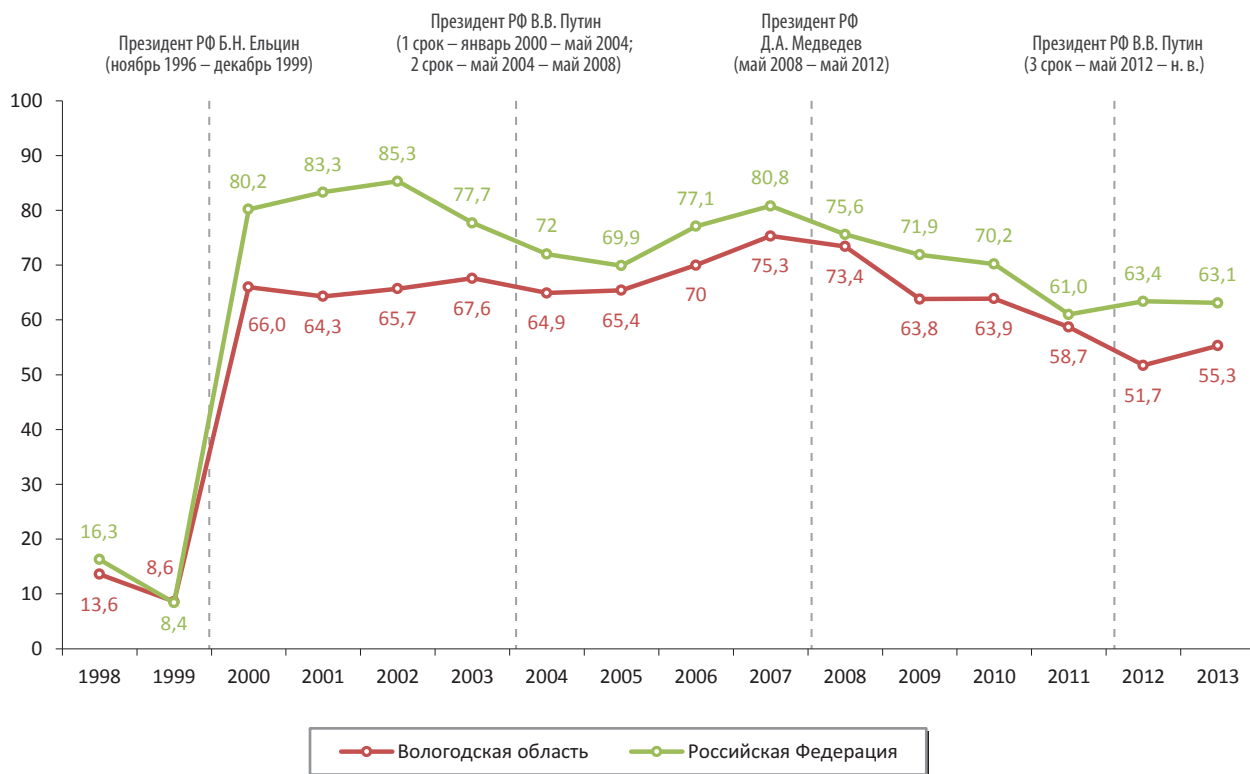
Рис. 1. Уровень одобрения деятельности президента РФ* в РФ и Вологодской области, % от числа опрошенных